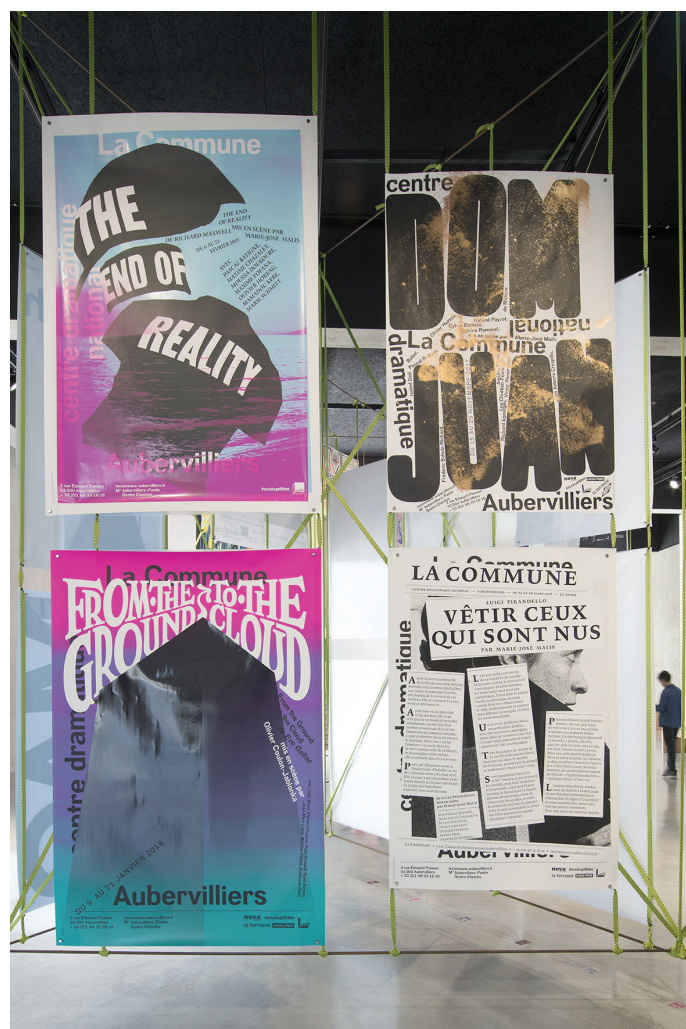
Vue de l'exposition du concours international d'affiches

La 3 e édition de la Biennale internationale de design graphique aura lieu de mai à septembre 2021 à Chaumont.