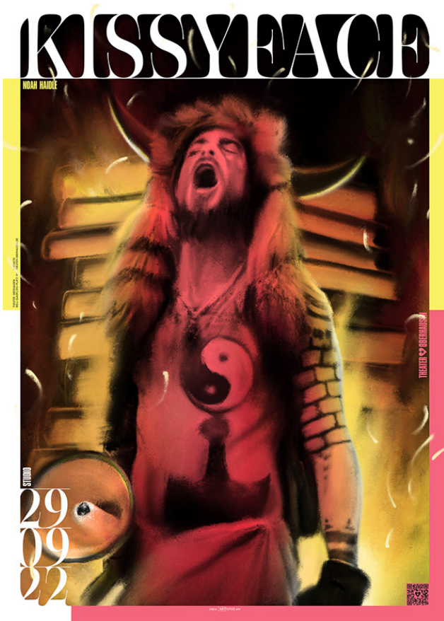
Kissyface, Théâtre d'Oberhausen, Allemagne, 2022.