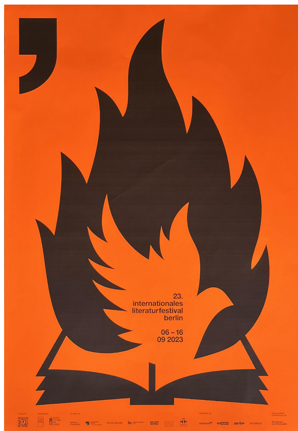
International Literature Festival Berlin, Allemagne, 2023