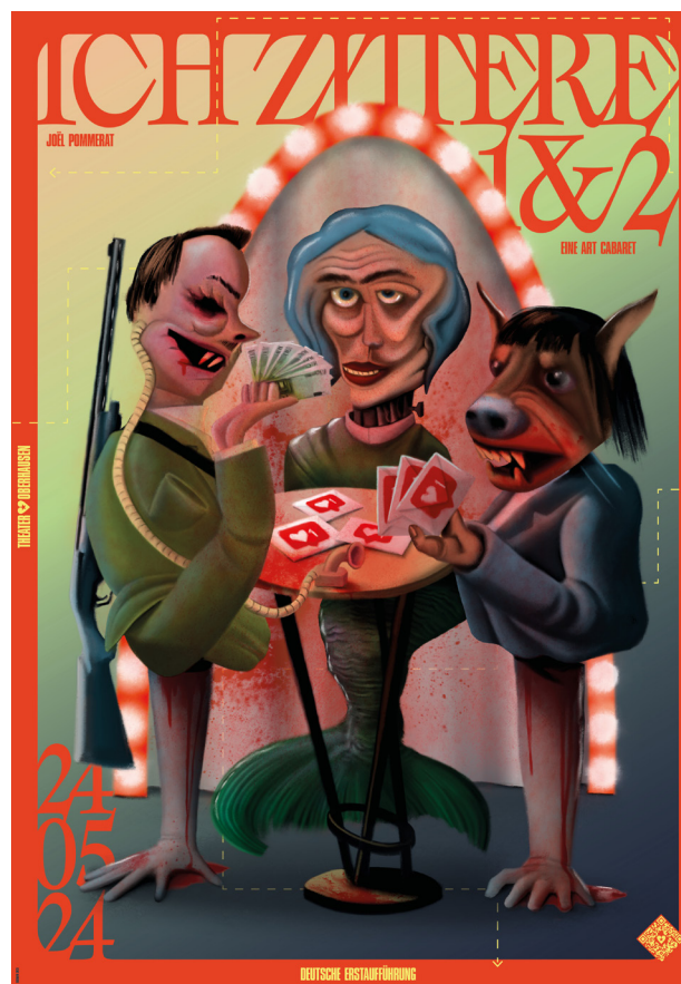
Ich Zittere 1 & 2, Théâtre d'Oberhausen, Allemagne, 2024.