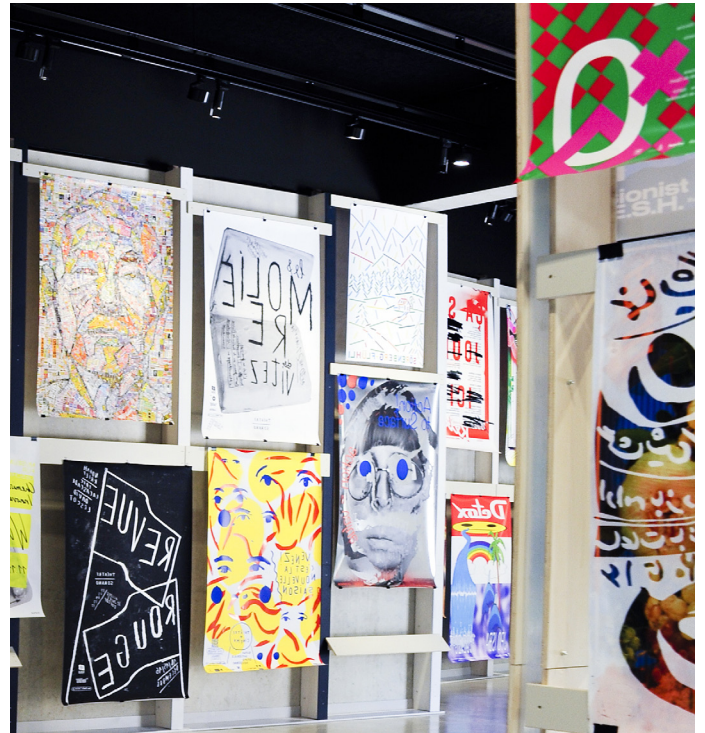
Vue de l'exposition du concours international d'affiches, Biennale du design graphique 2017.

Le public découvrira une programmation qui met en lumière aussi bien la jeune création que des artistes majeurs de la scène du design graphique avec les expositions monographiques de Frédéric Teschner, Karl Nawrot, Camille Trimardeau et des expositions thématiques telles que La Fabrique de l'affiche , les plus beaux livres français et le concours étudiant.