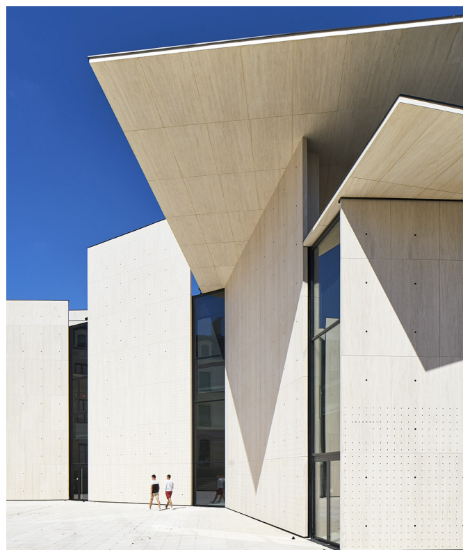
Le Signe, centre national du graphisme, Chaumont

Écrin architectural d'exception, le Signe se situe dans l'ancienne Banque de France, datant de 1867, qui a été réhabilitée et agrandie par l'agence d'architecture Moatti & Rivière.