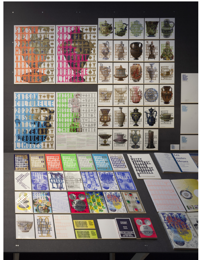
Vue de l'exposition - Applications