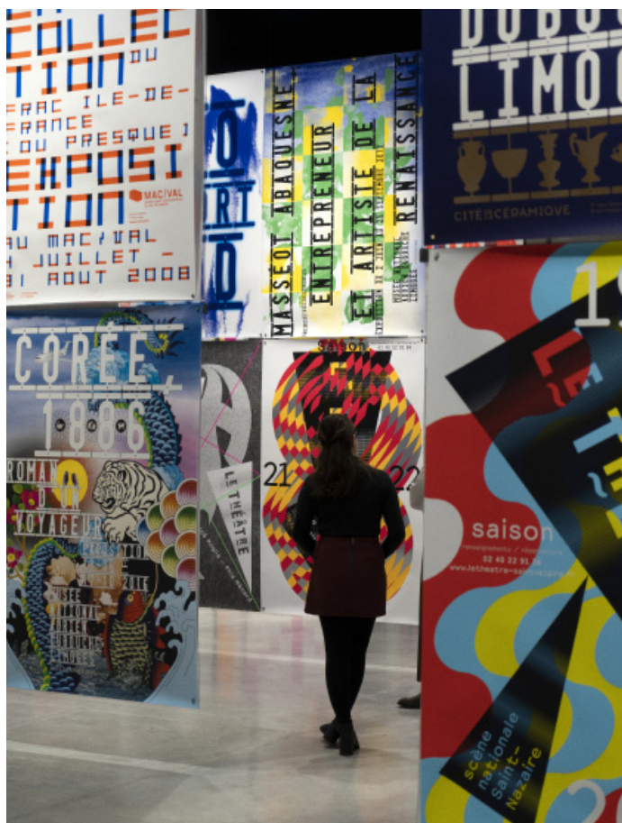
Vue de l'exposition - Partie 3 Immersion