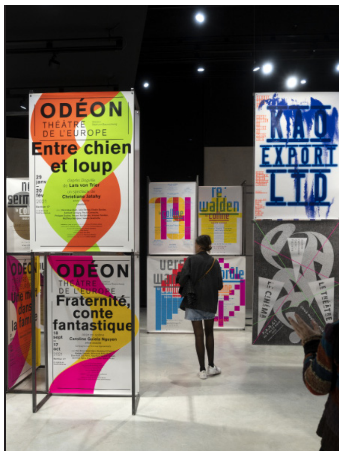
Vue de l'exposition - Partie 3 Immersion