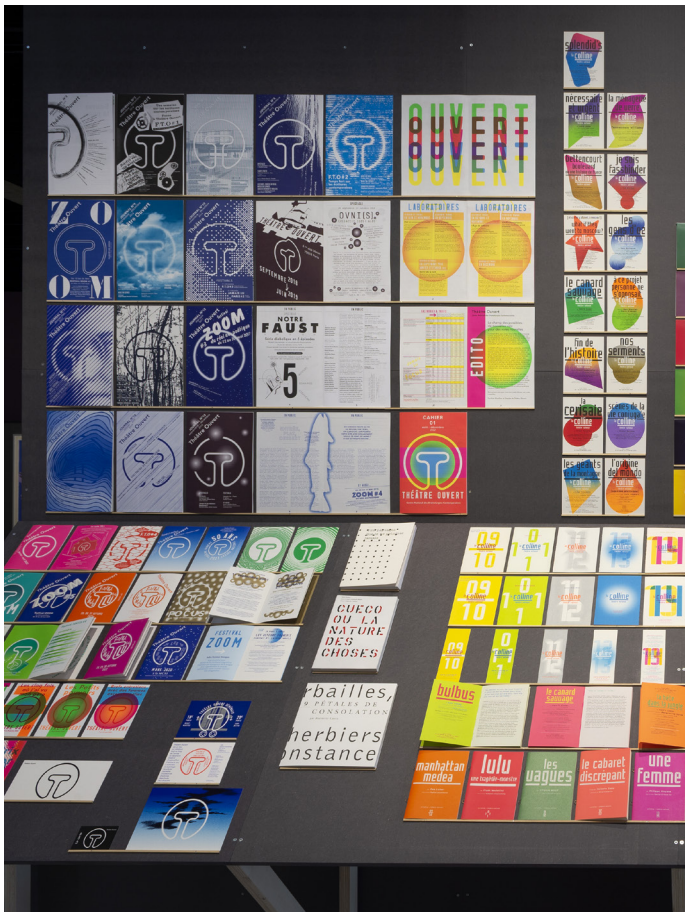
Vue de l'exposition - Applications