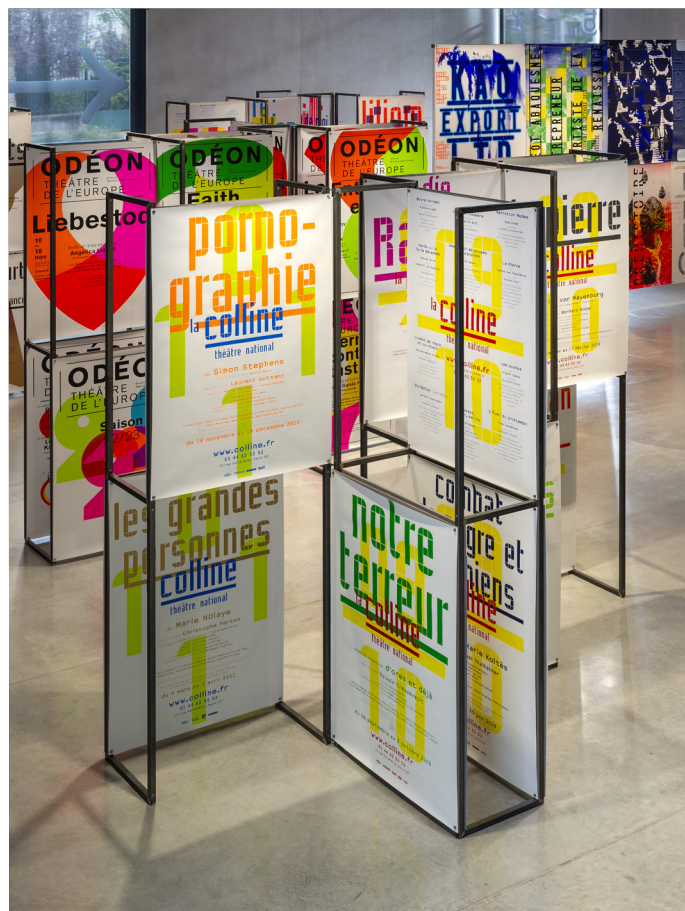
Vue de l'exposition Works/Travaux - Immersion

C'est donc en France qu'ils se rencontrent et fondent, en 1997, l'Atelier ter Bekke & Behage, atelier de création graphique spécialisé dans la communication dite « d'utilité publique ».