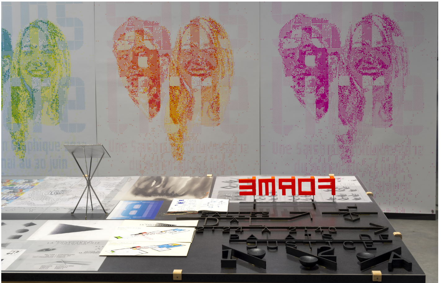
Vue de l'exposition - Partie 1 Réflexions