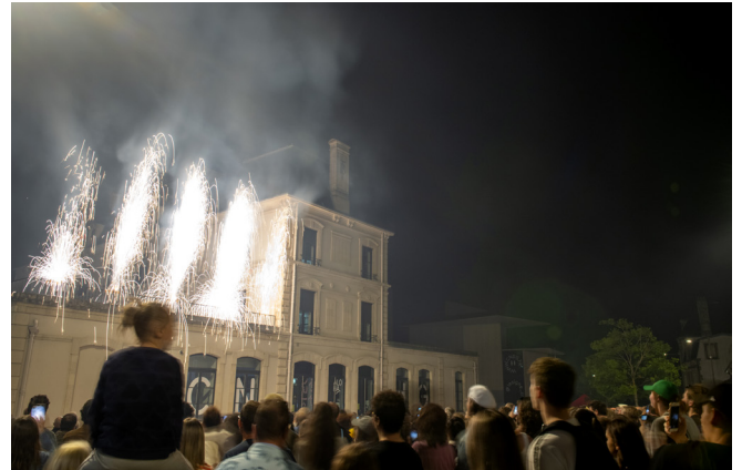
Vue du Signe, centre national du graphisme, week-end inaugural de la 4e Biennale internationale de design graphique, Chaumont (52000), Ville de Chaumont (à gauche), Marc Domage (à droite), 2023