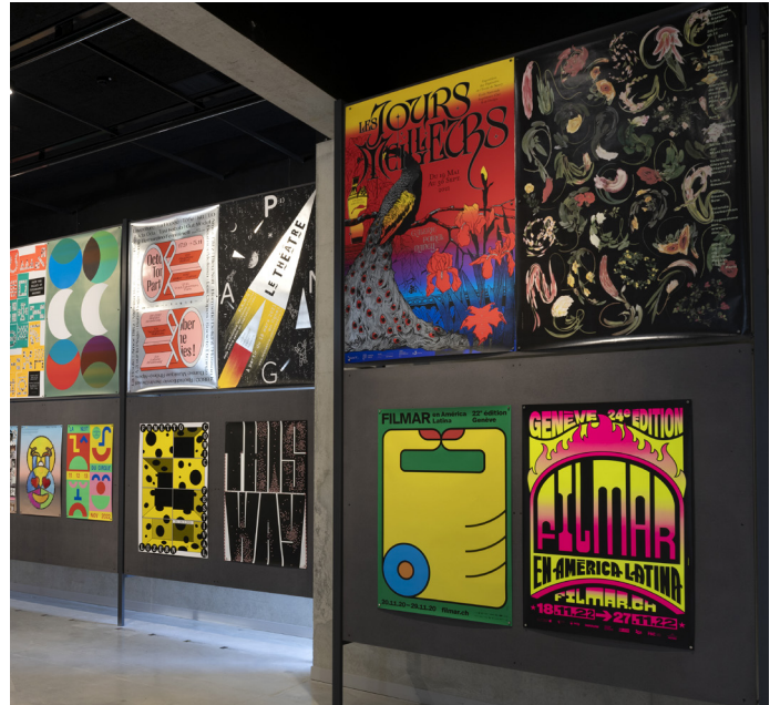
vue d'exposition, sélection du 30 e concours international d'affiches, Marc Domage, 2023