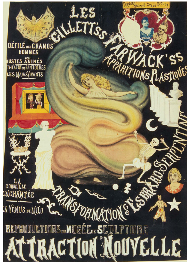
Les Gillett's Farwack'ss, auteur anonyme, gouache, collage, France, date inconnue, circa 1900.

Conçues il y a plus de cent ans et reflètes de leur époque, certaines images de l'exposition ont un caractère susceptible d'heurter la sensibilité des publics, par des représentations de personnes, des corps, des scènes de violence et de nudité.