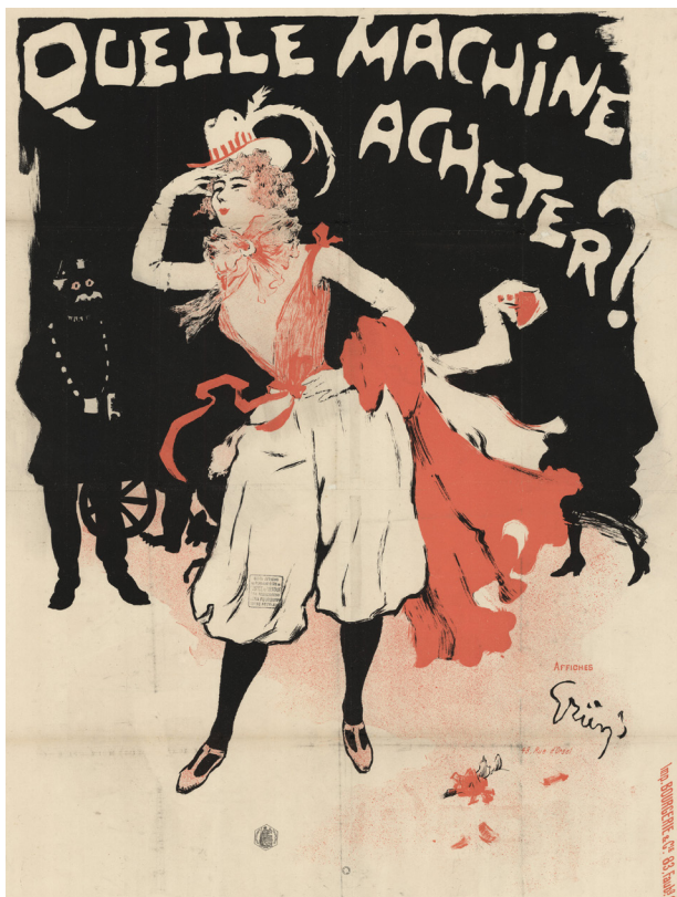
Quelle Machine Acheter ? Ah ! Une Whitworth !, Jules-Alexandre Grün, chromolithographie, France, 1897.